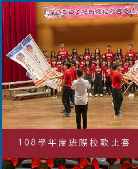
108學年度班際校歌比賽