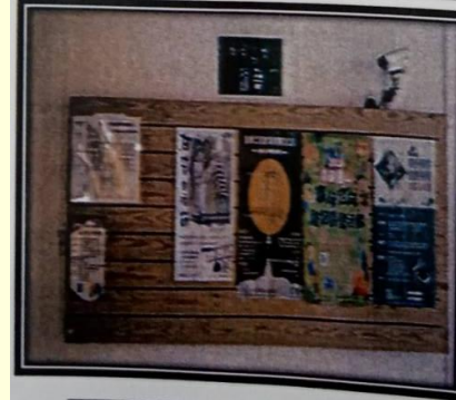
活動中心二樓海報牆