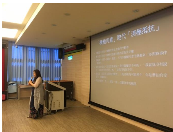
說明：講師說明積極同意之概念