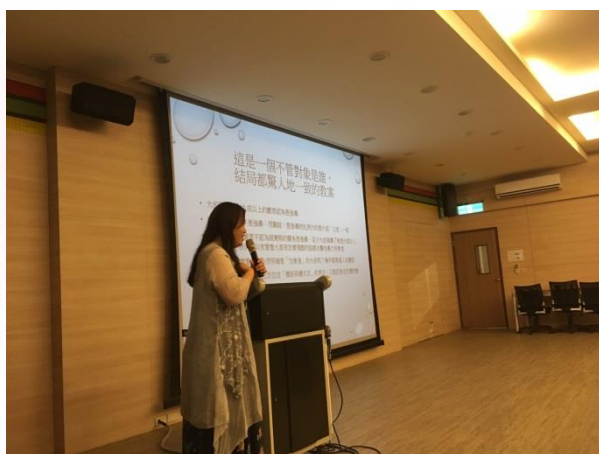
說明：講師透過體驗式教學引導同學反思