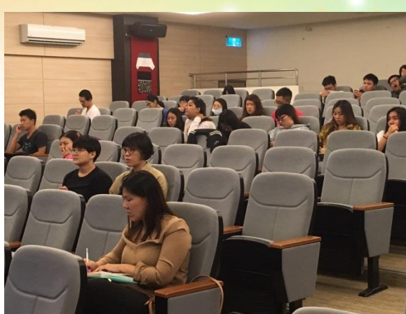
說明：同學專注聽講情形