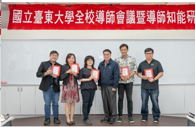
說明：110學年度優良導師與校長大合照