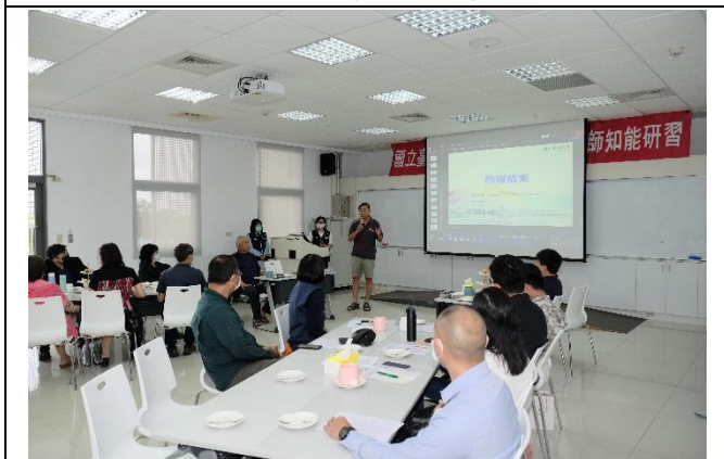
說明：魏副校長宣導性平觀念推廣