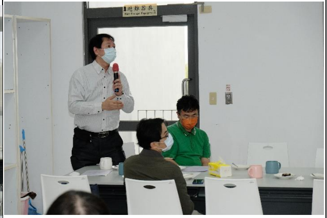
說明：Q&A時間導師回饋