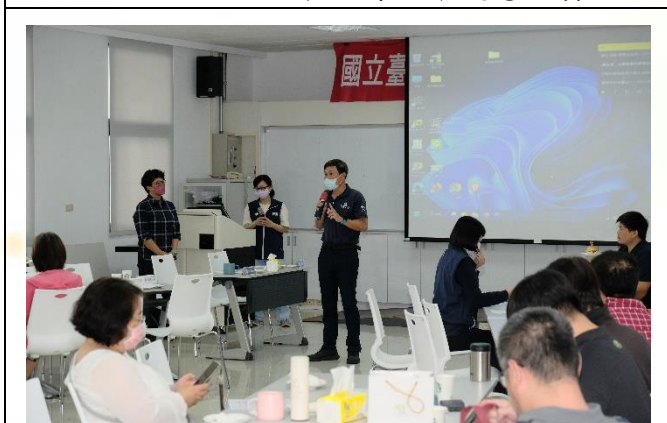
說明：學務處業務報告