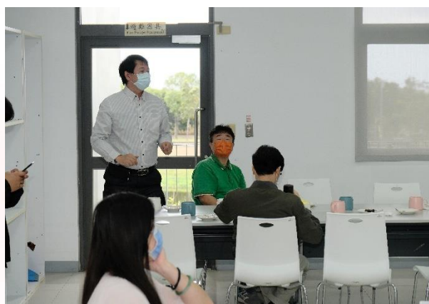
說明：Q&A時間導師回饋