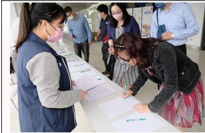
說明：與會來賓簽到