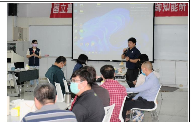
說明：學務處業務報告