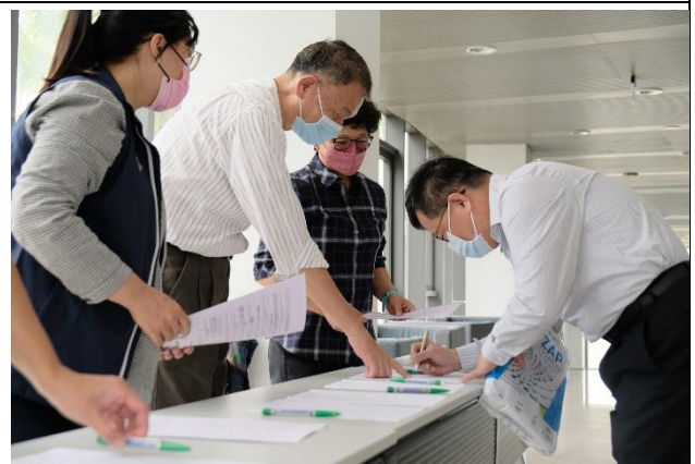
說明：與會來賓簽到