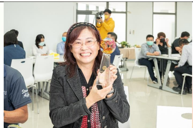
說明：優良導師獲獎花絮