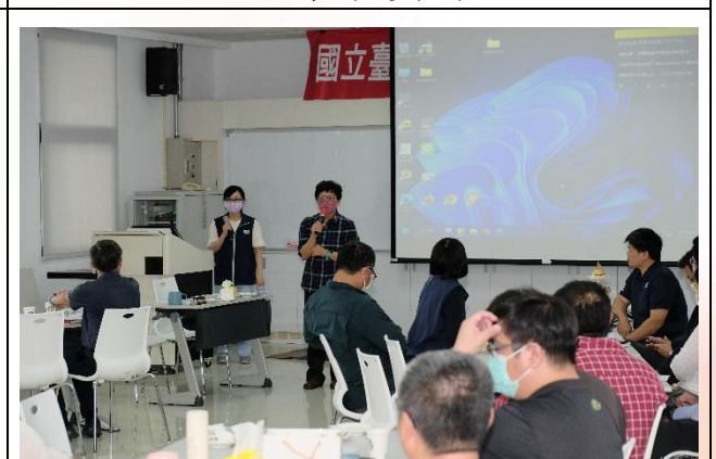
說明：學務處業務報告