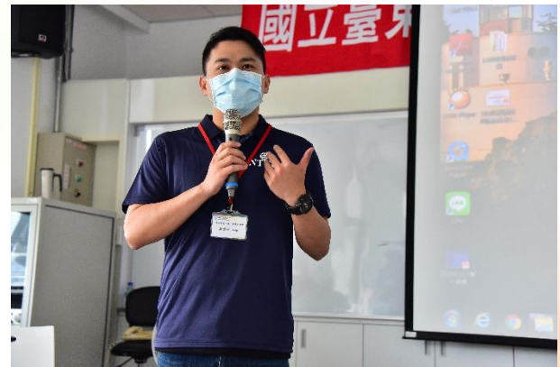
說明：學務處業務報告-職涯中心