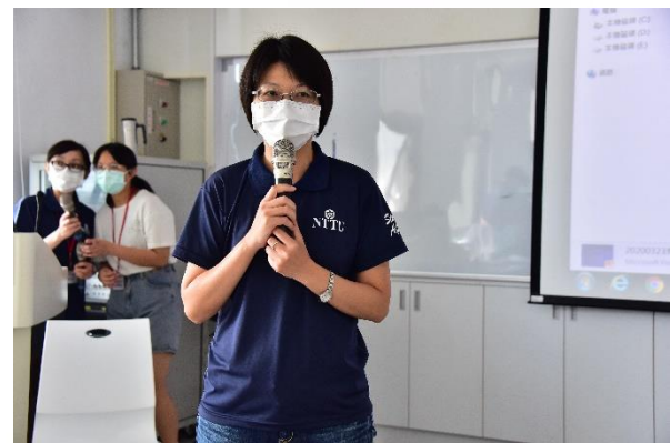
說明：學務處業務報告-生輔組