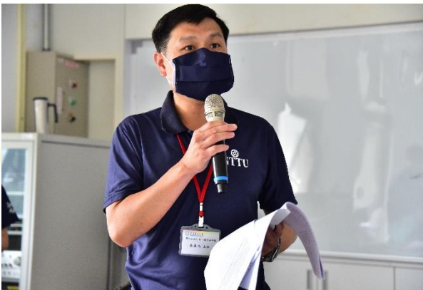
說明：學務處業務報告-校安中心