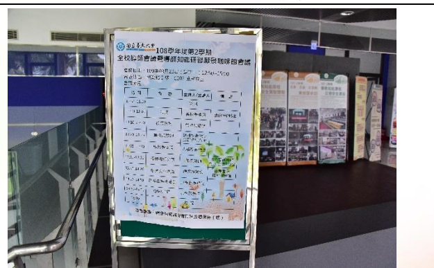
說明：會議議程海報