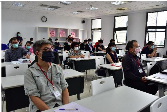
說明：會議活動進行中