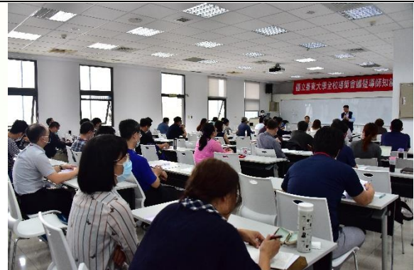
說明：會議活動進行中