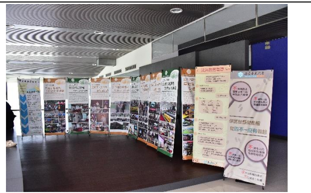
說明：會場外宣導布置