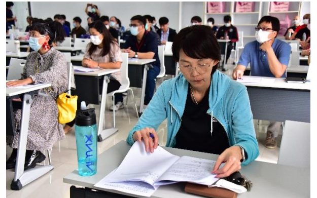
說明：會議活動進行中