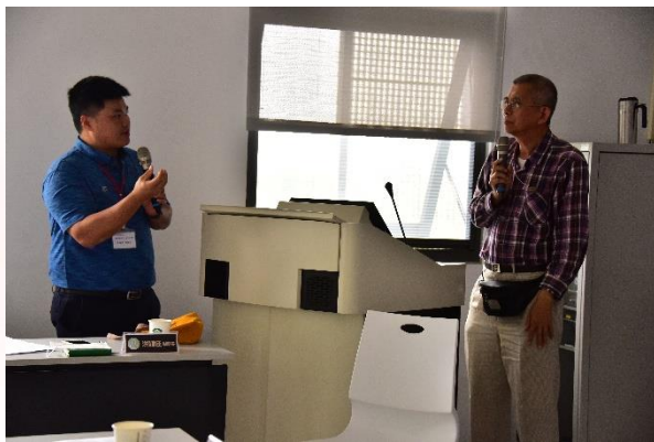
說明：用藥安全宣導Q&A