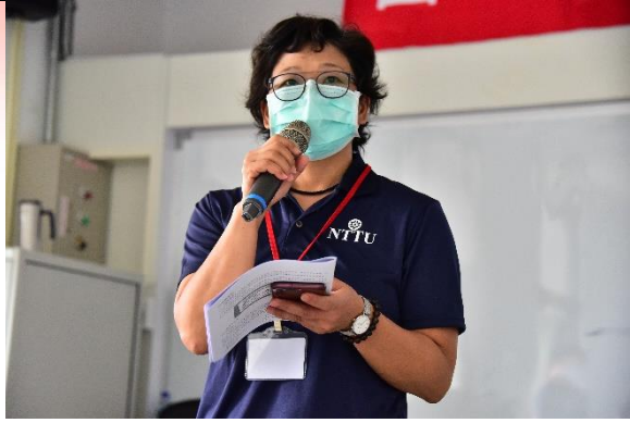
說明：學務處業務報告-心輔組