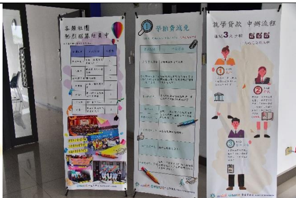
說明：會場外宣導布置