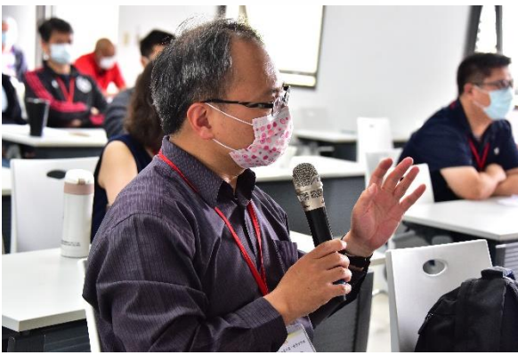
說明：用藥安全宣導Q&A