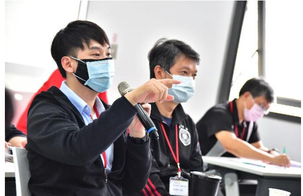
說明：用藥安全宣導Q&A