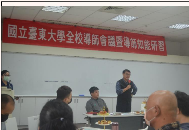
說明：長官致詞-校長致詞