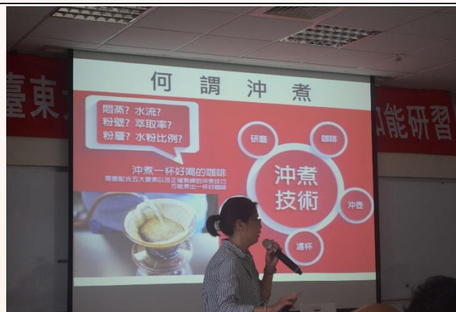
說明：活動二-講師講解手沖咖啡技巧