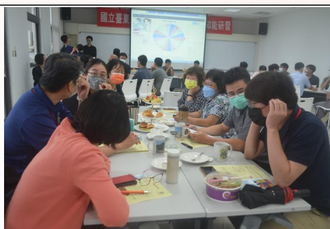
說明：個案演練-分組討論