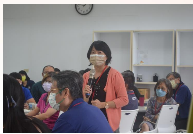
說明：個案演練-分享時間