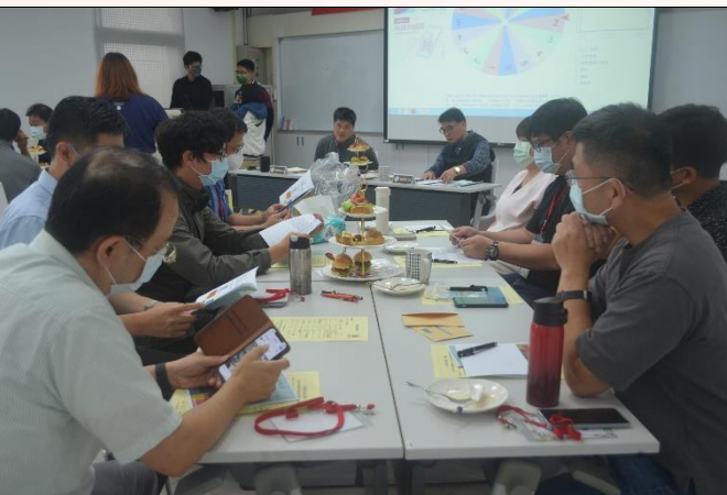
說明：個案演練-分組討論