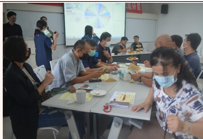
說明：個案演練-分組討論