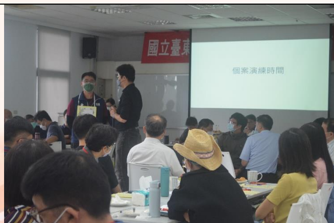
說明：個案演練-心輔組示範