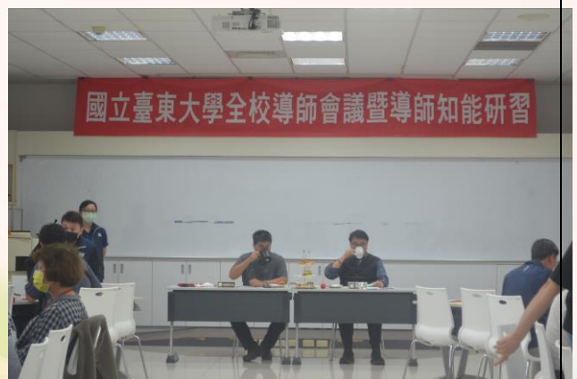
說明：會議即將開始