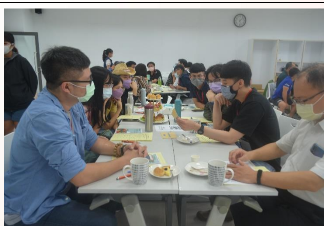
說明：個案演練-分組討論