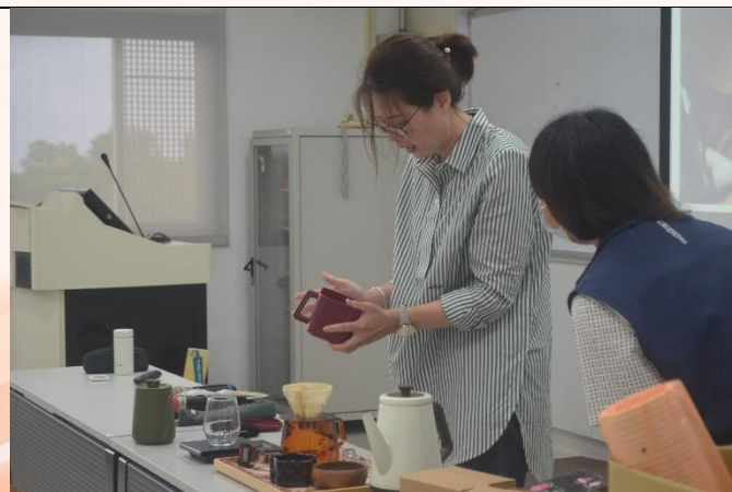
說明：活動二-講師示範手沖咖啡