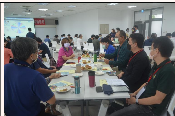
說明：個案演練-分組討論