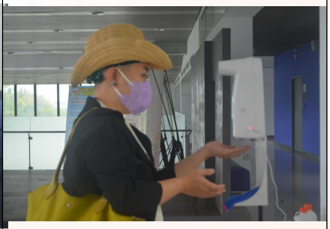
說明：量測額溫及消毒