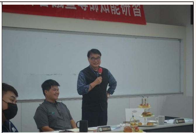
說明：長官致詞-校長致詞