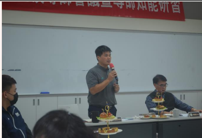
說明：長官致詞-學務長致詞