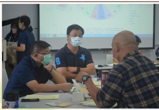
說明：個案演練-分組討論