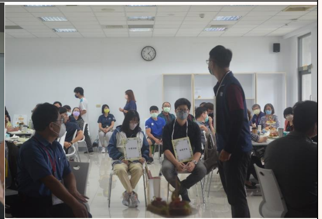
說明：個案演練-心輔組示範