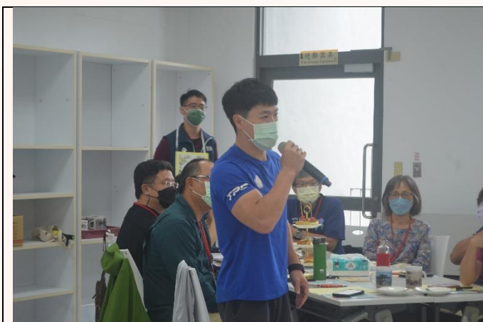
說明：個案演練-分享時間