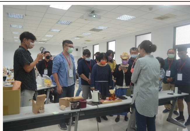
說明：活動二-講師示範手沖咖啡