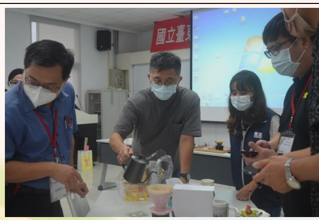
說明：活動二-分組練習手沖咖啡